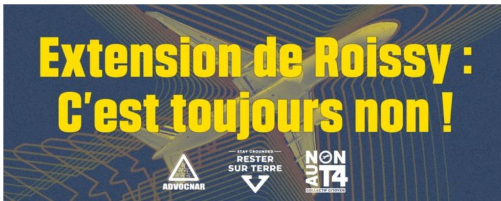
Affiche NON à l'extension