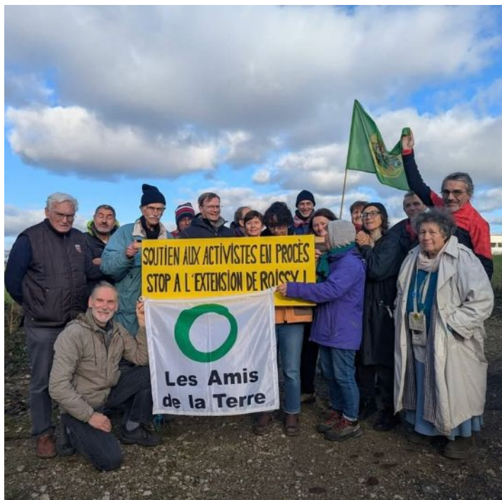
Photo de Zadimanche du 30 novembre avec banderole

Procès en appel des sept militants : "une pièce de théâtre de l'absurde"