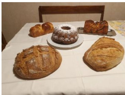
Villarceaux pains décembre 2025