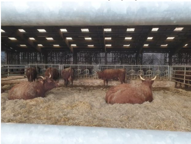
Villarceaux - vaches décembre 2025

Nous n'allions pas visiter la ferme mais uniquement les nouvelles installations (même si nous avons pu admirer à l'étable les dizaines de vaches et quelques petits veaux).