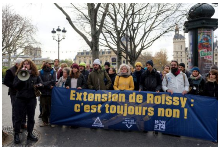
Photo de groupe

1er et 3 décembre 2025 : Procès en appel de sept militant·es mis en examen pour intrusion sur l'aéroport de Roissy, relaxés en première instance