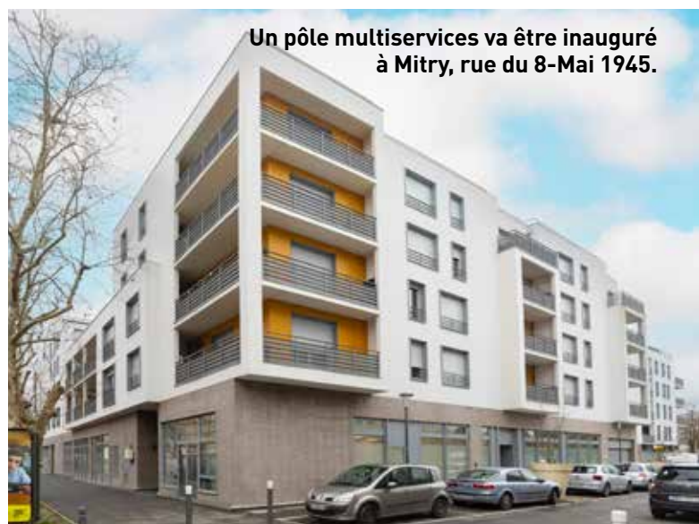
Un pôle multiservices va être inauguré à Mitry, rue du 8-Mai 1945.

La rue Julien-Mira, près de la gare, s'est embellie grâce à l'action d'une restauratrice, qui a bénéficié du soutien de la Ville.