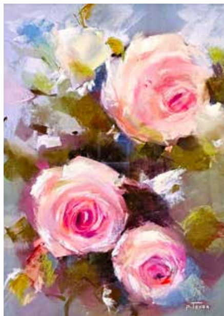
Figure bien connue de l'Association des peintres et sculpteurs aulnaysiens (Apsa), Pierrette Tahon vous

aidera à obtenir assez rapidement de très beaux résultats.