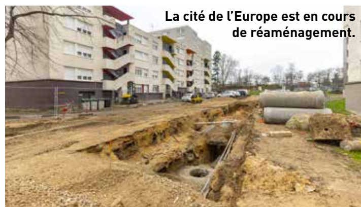
La cité de l'Europe est en cours de réaménagement.

Cité de l'Europe. De l'autre côté de la RN2, la cité de l'Europe fait également sa mue. Les espaces publics ont commencé à être réaménagés en 2024. Une nouvelle rue est en construction pour désenclaver les habitations, améliorer le stationnement et relier le quartier à la future gare du Grand Paris Express. D'ici à 2026, 800 logements Emmaüs seront rénovés.