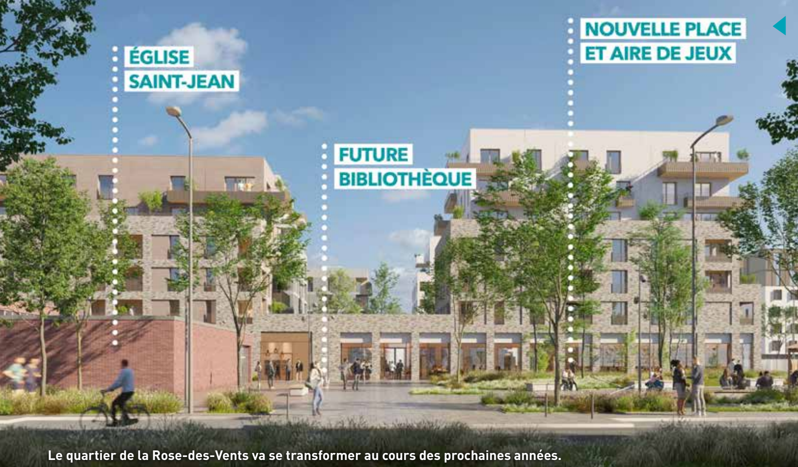
Le quartier de la Rose-des-Vents va se transformer au cours des prochaines années.

d'euros, subventionnés à 90 %. Quant à l'ensemble Pascarel au Gros-Saule, sa réhabilitation se poursuit.