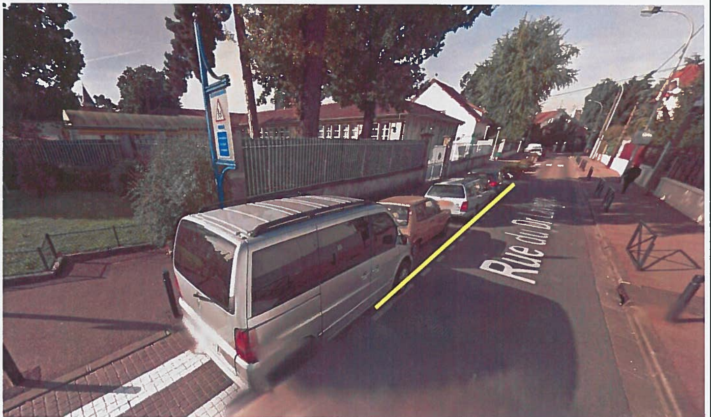
FOURNITURE ET POSE DE BARRIERES GRILLAGEES SUR CHAUSSEE

AMENAGEMENT VIGIPIRATE MATERNELLE REPUBLIQUE