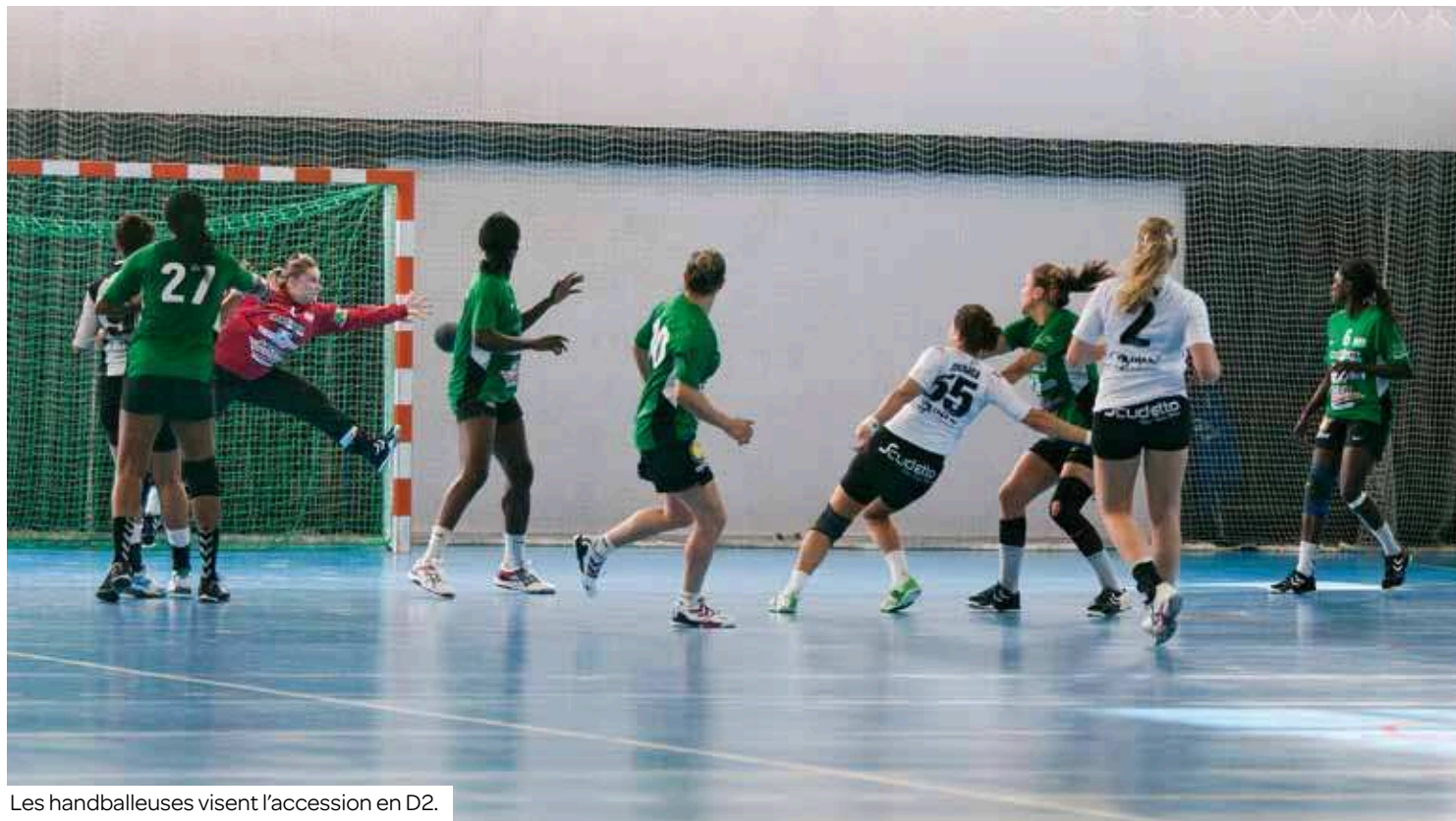
Les handballeuses visent l'accession en D2.

Les handballeuses n'ont jamais été aussi bien classées qu'en ce début de championnat en N1, confirmant ainsi l'objectif annoncé de la montée. À condition de maintenir rythme et cap en même temps.