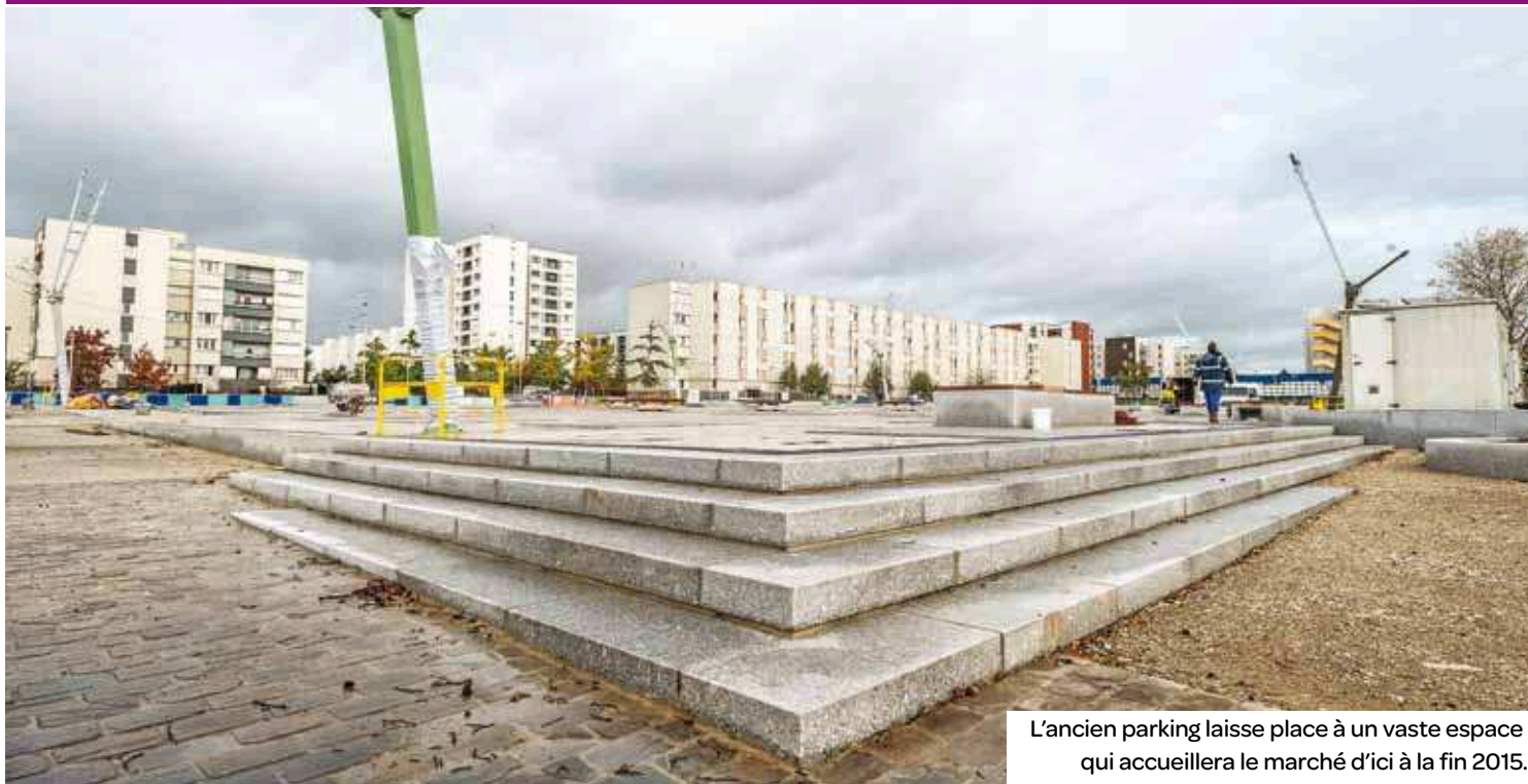
L'ancien parking laisse place à un vaste espace qui accueillera le marché d'ici à la fin 2015.