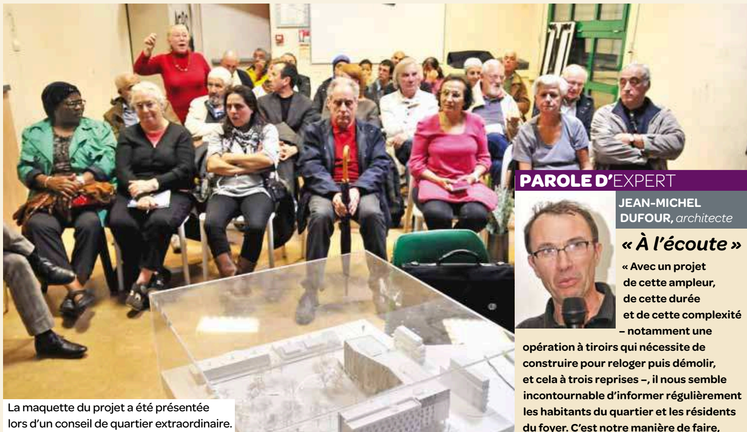
La maquette du projet a été présentée lors d'un conseil de quartier extraordinaire.

À l'invitation du conseil de quartier, les riverains de la Rose-des-Vents se sont réunis le 6 novembre pour découvrir le futur projet du foyer de travailleurs migrants.