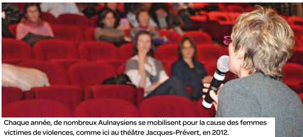
Chaque année, de nombreux Aulnaysiens se mobilisent pour la cause des femmes victimes de violences, comme ici au théâtre Jacques-Prévert, en 2012.

Dans le cadre de la Journée internationale de lutte contre les violences faites aux femmes, le Bureau d'aide aux victimes organise le 25 novembre une projection-débat autour du film saoudien Wadjda .