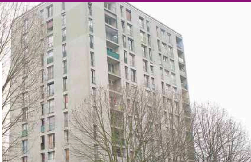
Les travaux de rénovation se poursuivront jusqu'au premier trimestre 2014