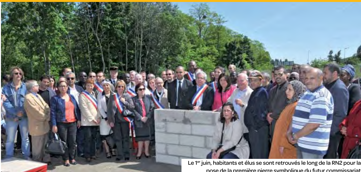
Le 1 er juin, habitants et élus se sont retrouvés le long de la RN2 pour la pose de la première pierre symbolique du futur commissariat.