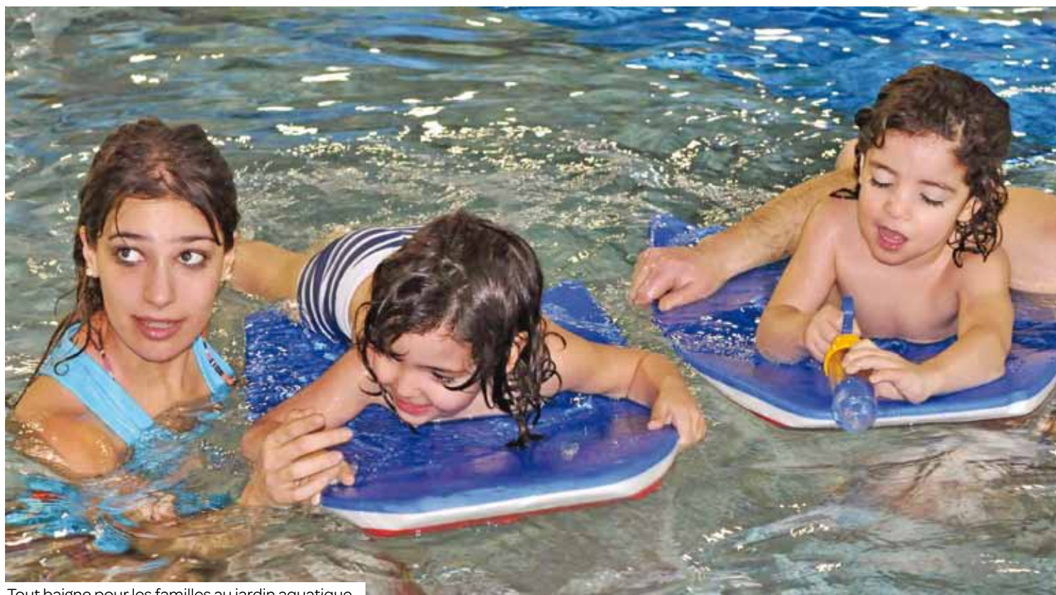
Tout baigne pour les familles au jardin aquatique.

Entre les bébés nageurs et les activités d'Aulnay sport natation, le jardin aquatique est une bonne manière pour les enfants de 3 à 5 ans d'apprivoiser l'élément liquide en famille. Il reste des places.