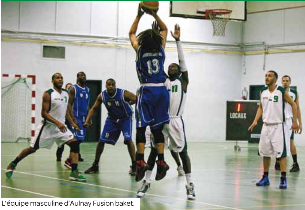
L'équipe masculine d'Aulnay Fusion basket.