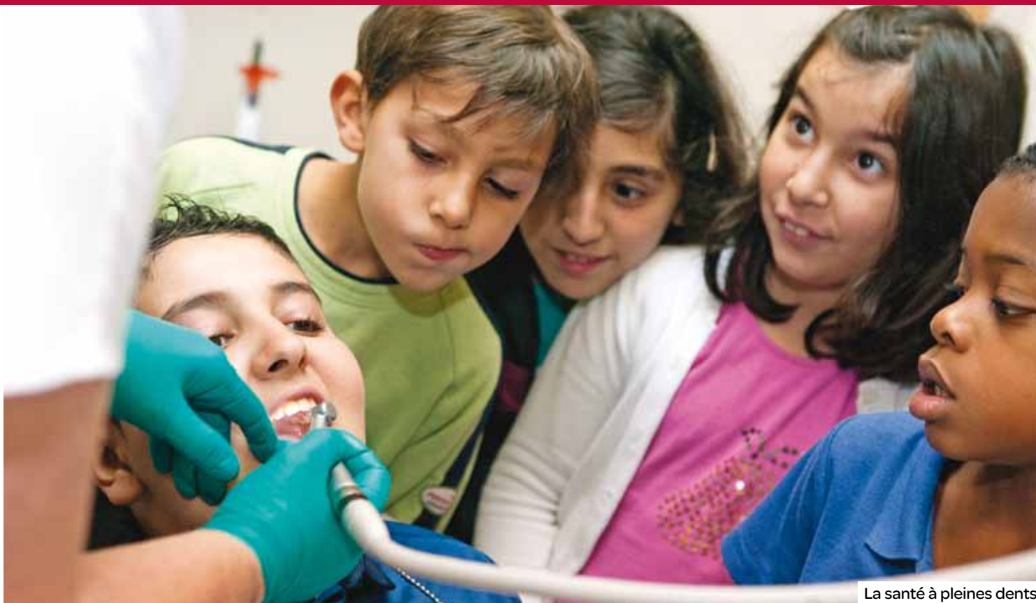
La santé à pleines dents.