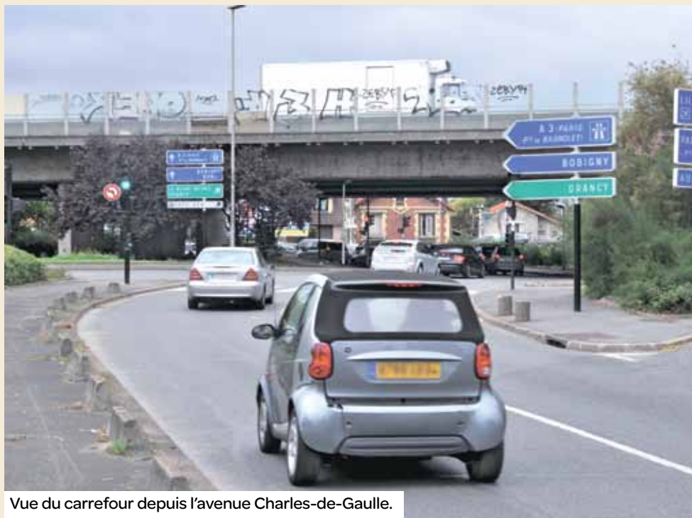
Vue du carrefour depuis l'avenue Charles-de-Gaulle.

Le comité de dénomination des rues souhaite rebaptiser ce carrefour dont le surnom est jugé désormais singulièrement dépréciatif.