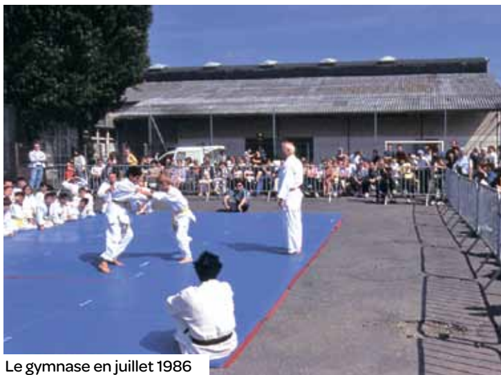
Le gymnase en juillet 1986

Salle de sport et haut lieu d'animation dans le quartier Nonneville, le gymnase du Havre, démoli cet été, embrasse soixante ans de la vie du quartier.