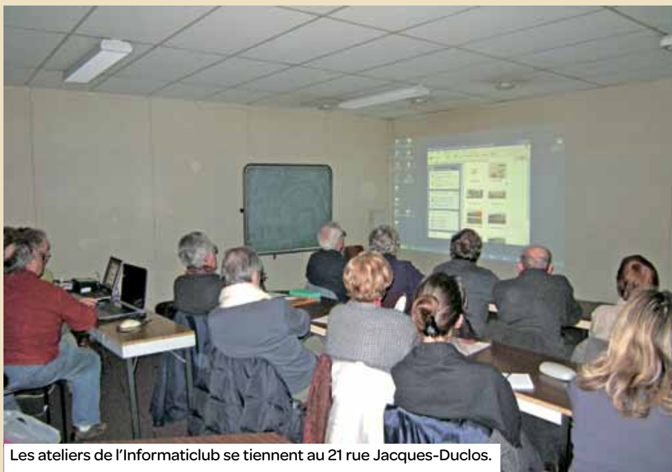
Les ateliers de l'Informaticlub se tiennent au 21 rue Jacques-Duclos.

Une fois par mois, l'Informaticlub propose aux utilisateurs de PC d'approfondir leurs connaissances sur leur outil informatique et d'en maîtriser les différentes applications.