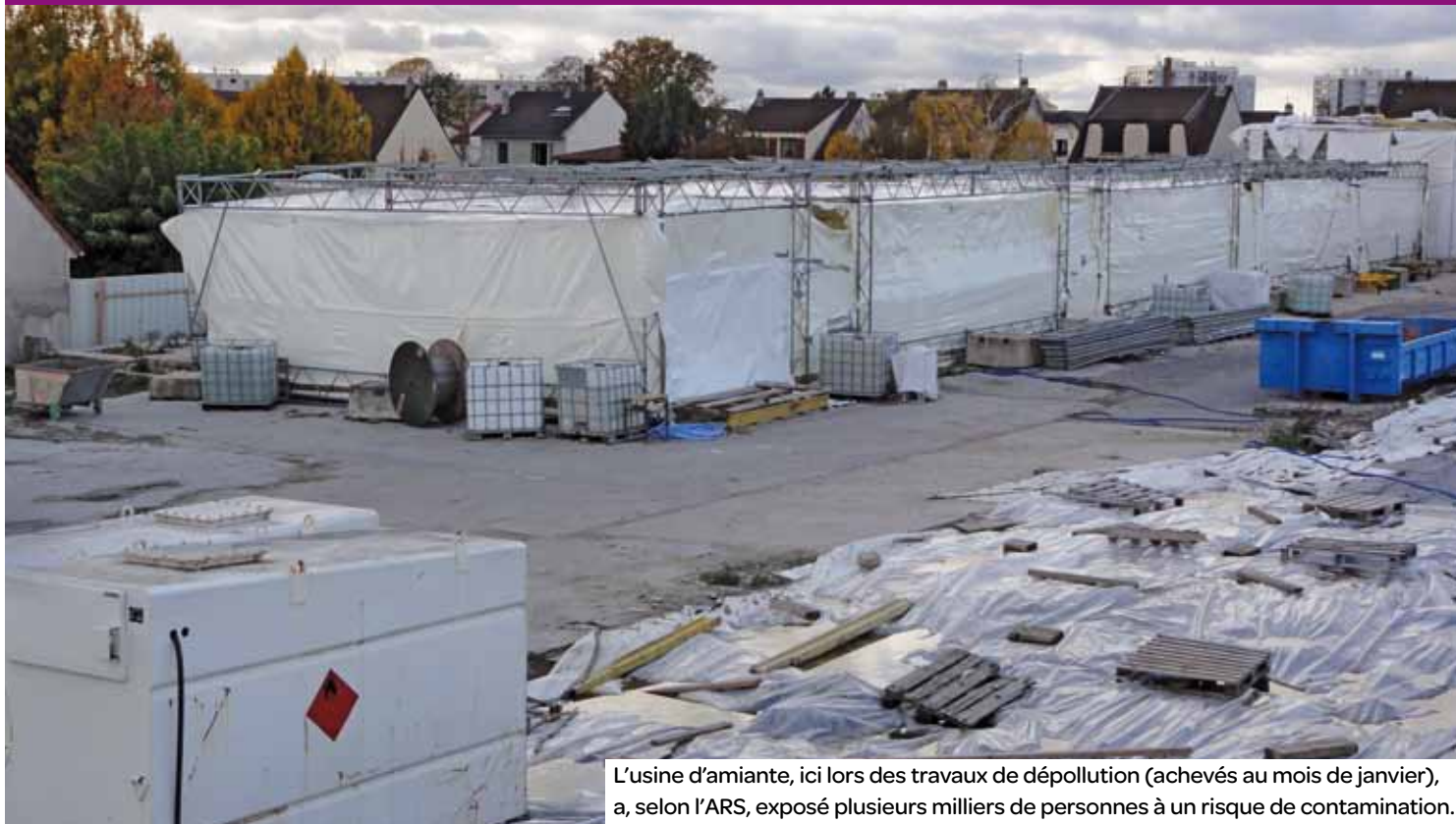
L'usine d'amiante, ici lors des travaux de dépollution (achevés au mois de janvier), a, selon l'ARS, exposé plusieurs milliers de personnes à un risque de contamination.