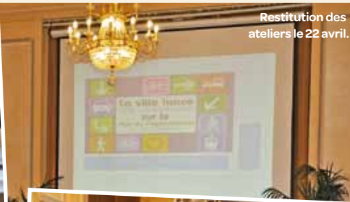
Restitution des ateliers le 22 avril.