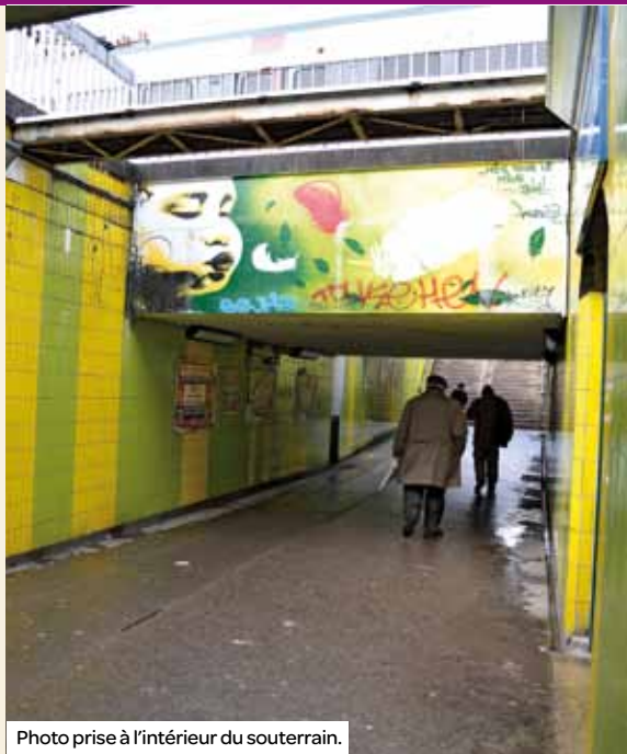
Photo prise à l'intérieur du souterrain.