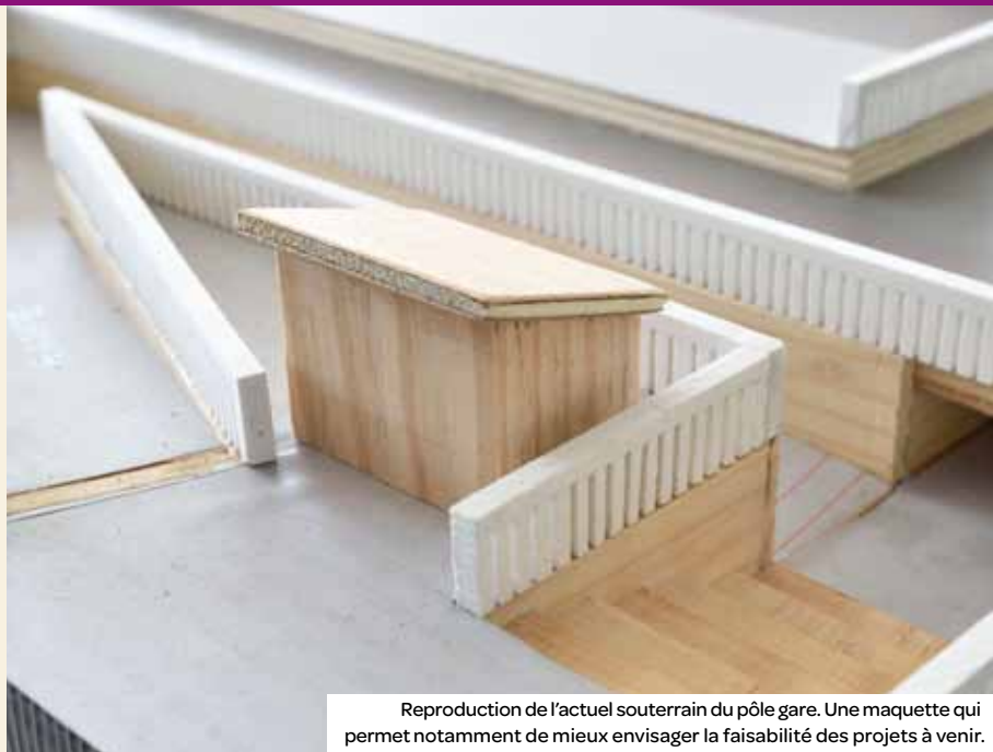
Reproduction de l'actuel souterrain du pôle gare. Une maquette qui permet notamment de mieux envisager la faisabilité des projets à venir.