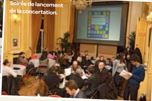
Soirée de lancement de la concertation.

Après une réunion de lancement au mois de février, trois ateliers de concertation en mars et leur restitution en avril, les habitants vont à nouveau pouvoir se prononcer, en ce mois de juin, sur la question du plan de déplacements.