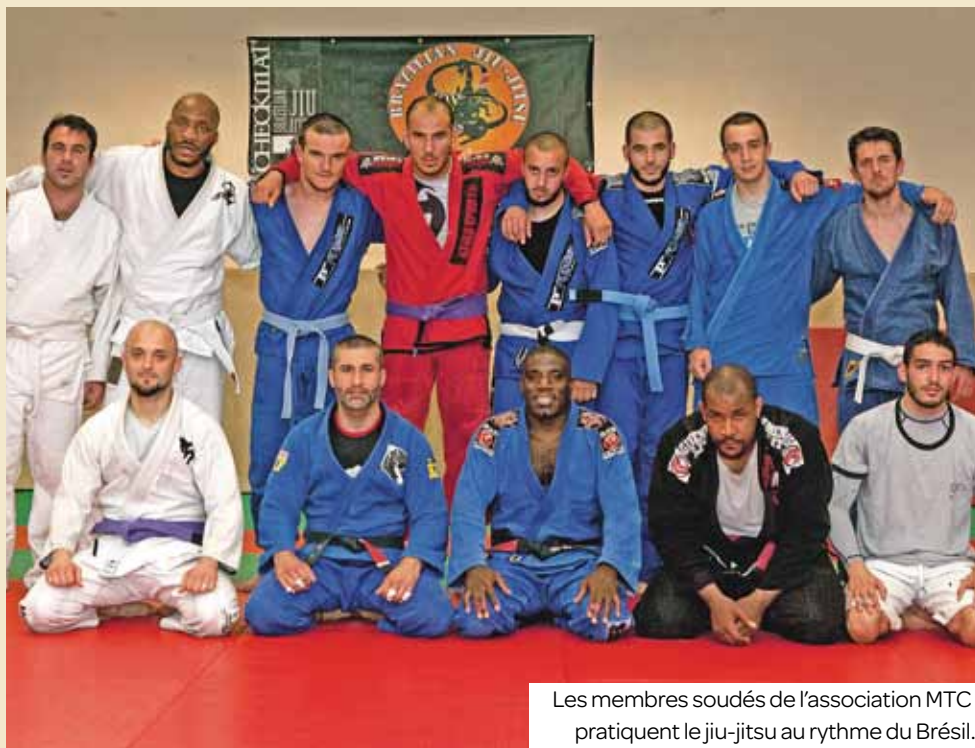
Les membres soudés de l'association MTC pratiquent le jiu-jitsu au rythme du Brésil.

Le MTC Style Elements est un ambassadeur du jiu-jitsu brésilien, cet art martial qui commence debout comme le judo et se termine au sol comme la lutte. Découverte.