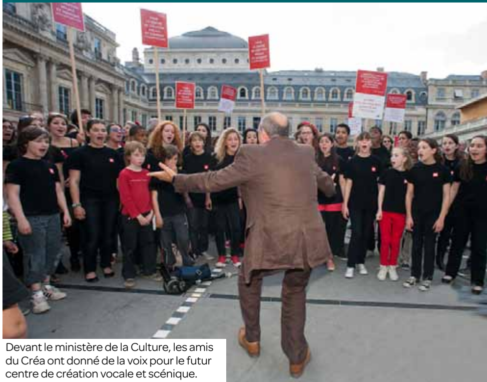
Devant le ministère de la Culture, les amis du Créa ont donné de la voix pour le futur centre de création vocale et scénique.