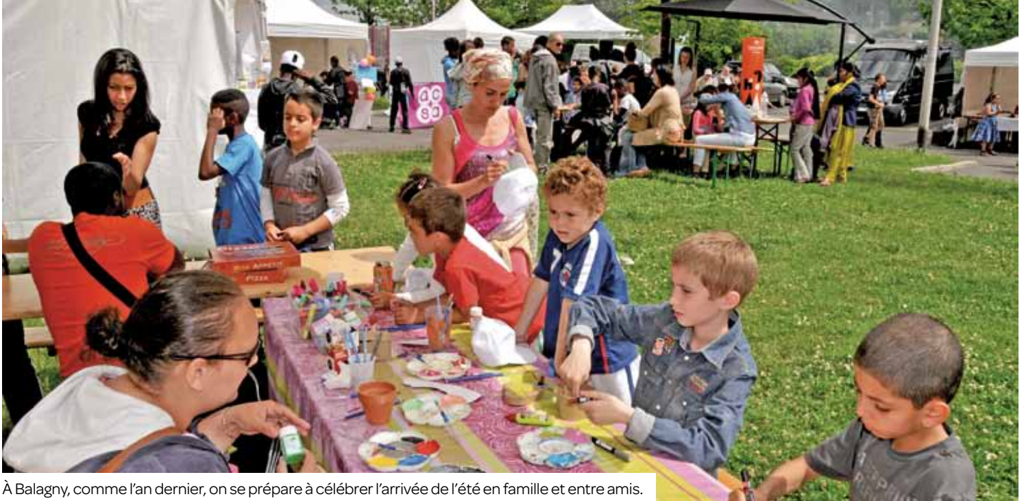
À Balagny, comme l'an dernier, on se prépare à célébrer l'arrivée de l'été en famille et entre amis.