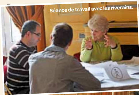
Séance de travail avec les riverains.

Après les ateliers menés avec la population autour du plan de déplacements dans le sud de la commune, la ville va faire réaliser une enquête auprès d'une centaine d'Aulnaysiens.