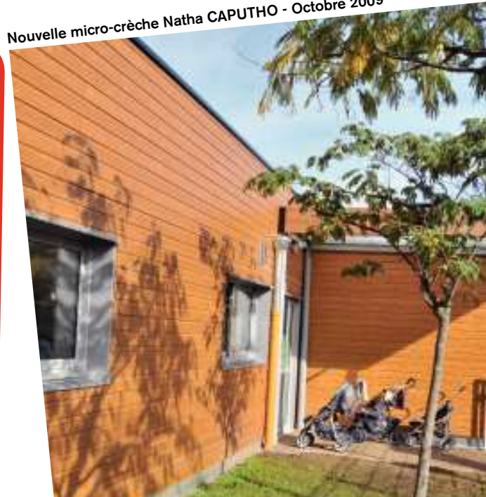
Nouvelle micro-crèche Natha CAPUTHO - Octobre 2009

Retrouvez la suite de nos points de vue dans la prochaine édition.