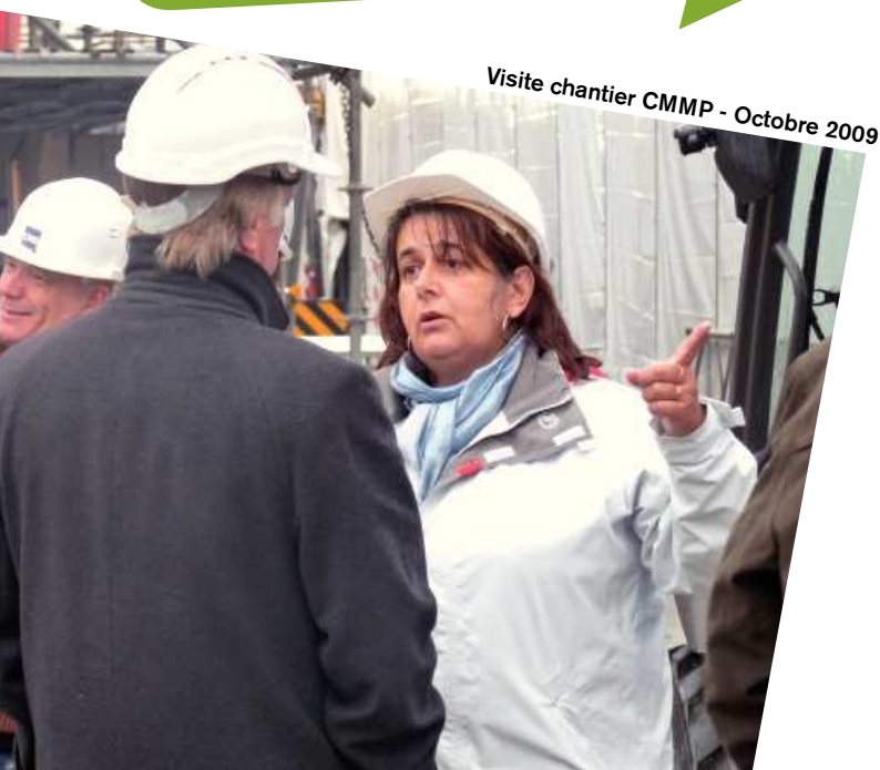
Visite chantier CMMP - Octobre 2009

L'Etat doit mettre les moyens financiers nécessaires à rechercher les victimes.