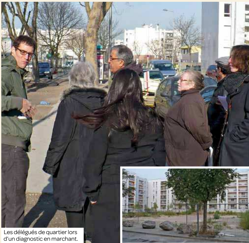
Les délégués de quartier lors d'un diagnostic en marchant.

Soucieux de vouloir associer les résidents à un projet d'aménagement de square, le conseil de quartier de la Rose-des-Vents a mené une enquête auprès de 223 personnes pour sonder leurs envies.