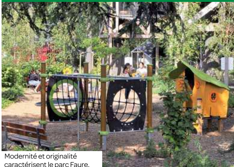
Modernité et originalité caractérisent le parc Faure.