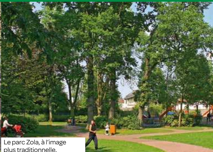
Le parc Zola, à l'image plus traditionnelle.