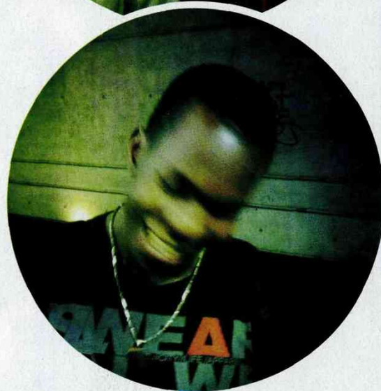
Mole (ci-dessus) : « Toujours une panne, un retard, un accident. »