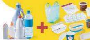
Tous les emballages en plastique sans exception.

Vous continuez à déposer dans votre bac de tri tous les emballages métalliques, les emballages en carton, les papiers et, en plus de cela, tous vos emballages en plastique sans exception.