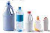
Bouteilles et flacons en plastique.

Vous déposiez dans votre bac de tri tous les emballages métalliques, les emballages en carton, les bouteilles et flacons en plastique.