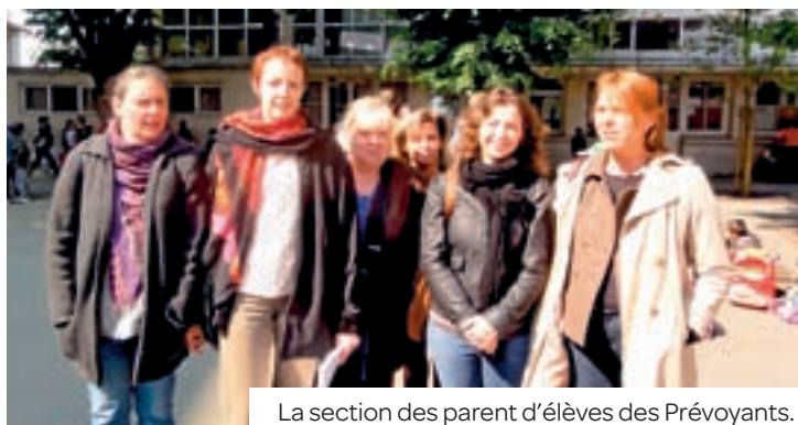
La section des parent d'élèves des Prévoyants.