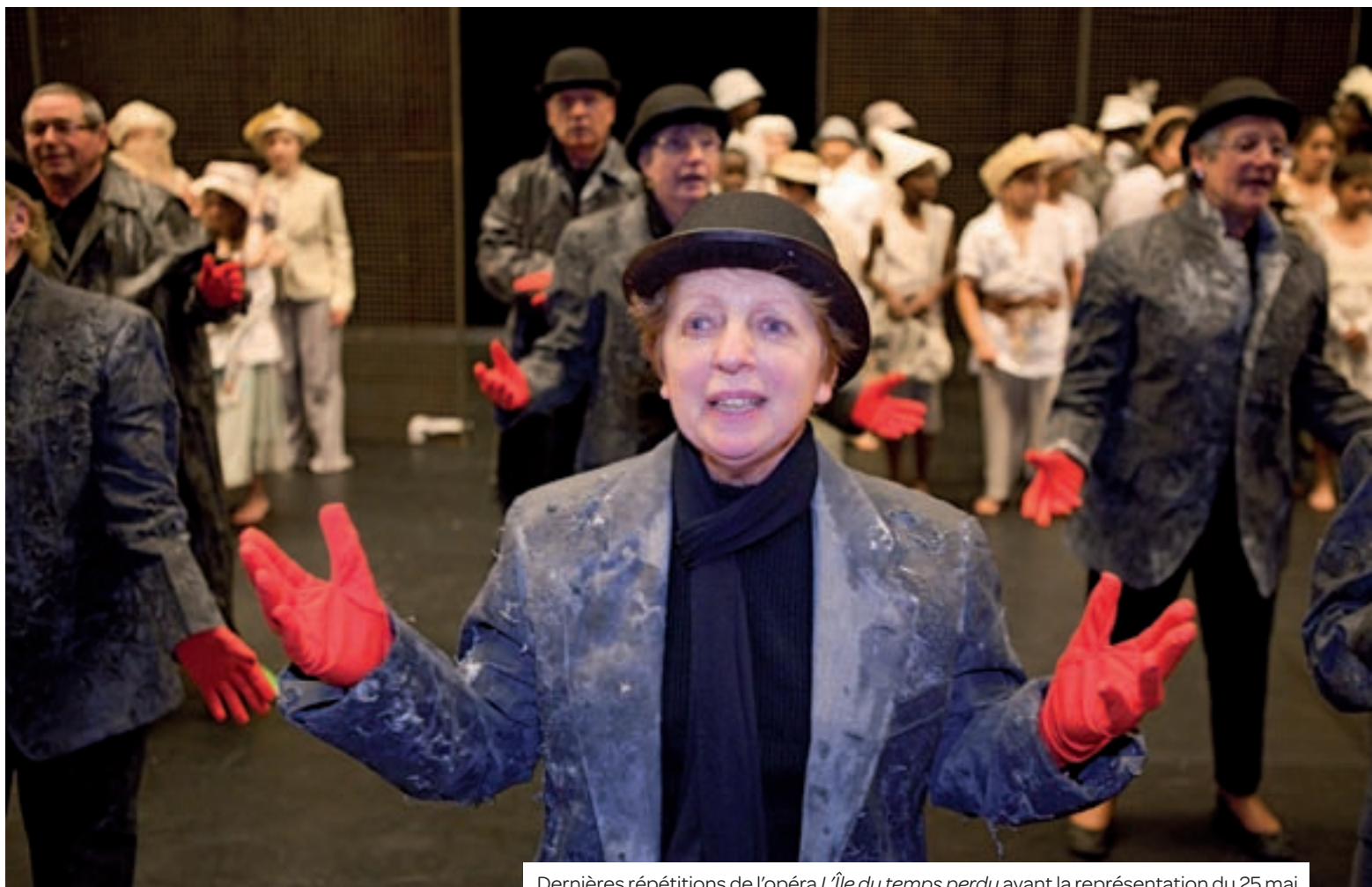
Dernières répétitions de l'opéra L'île du temps perdu avant la représentation du 25 mai.

Le 25 mai prochain, l'opéra « L'île du temps perdu » sera présenté à l'espace Jacques-Prévert. Depuis septembre dernier, deux classes de CM2, des seniors et leurs équipes pédagogiques travaillent à la présentation d'un projet unique et ambitieux, symbole d'union entre tous les habitants de la ville.