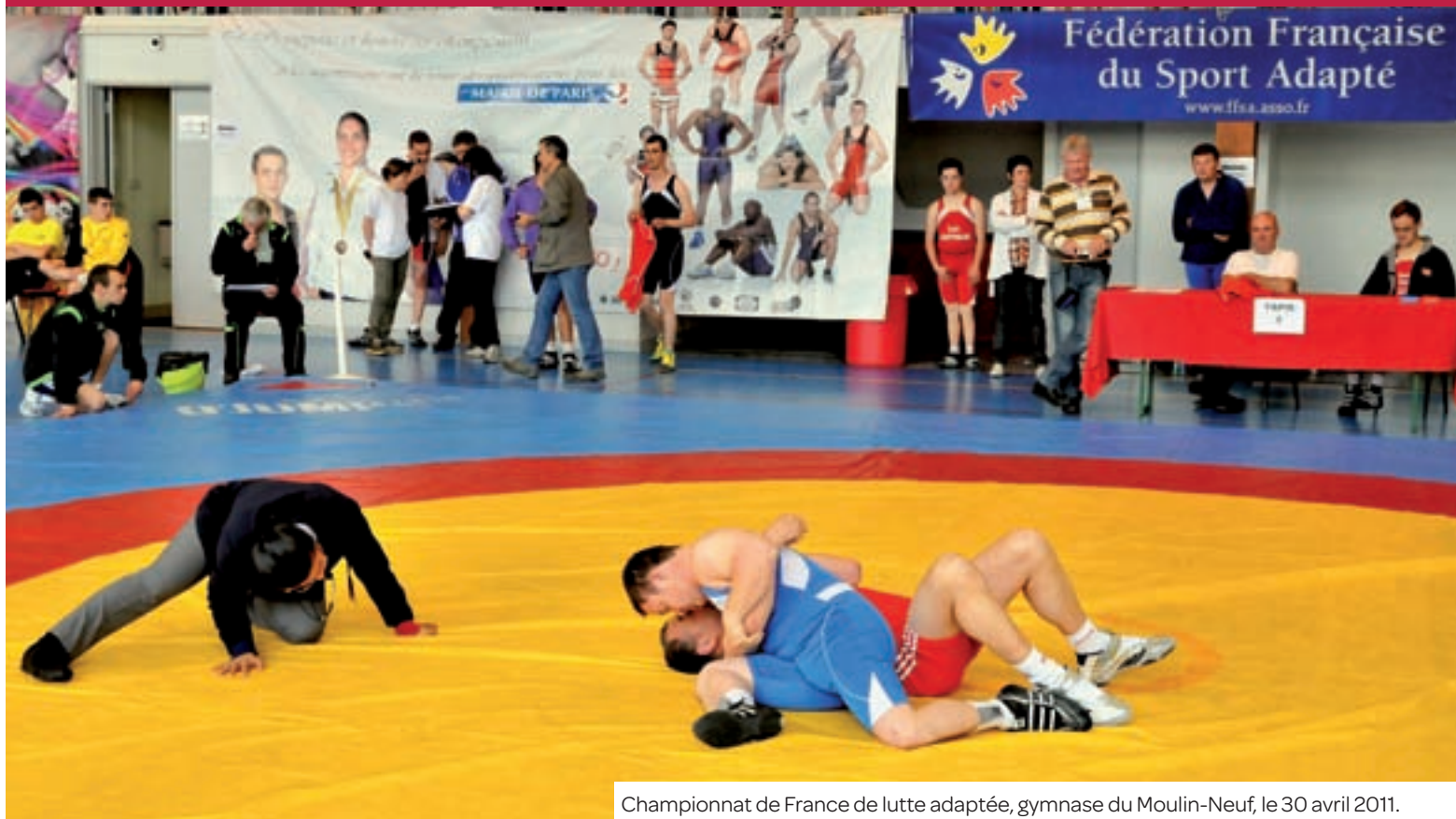
Championnat de France de lutte adaptée, gymnase du Moulin-Neuf, le 30 avril 2011.