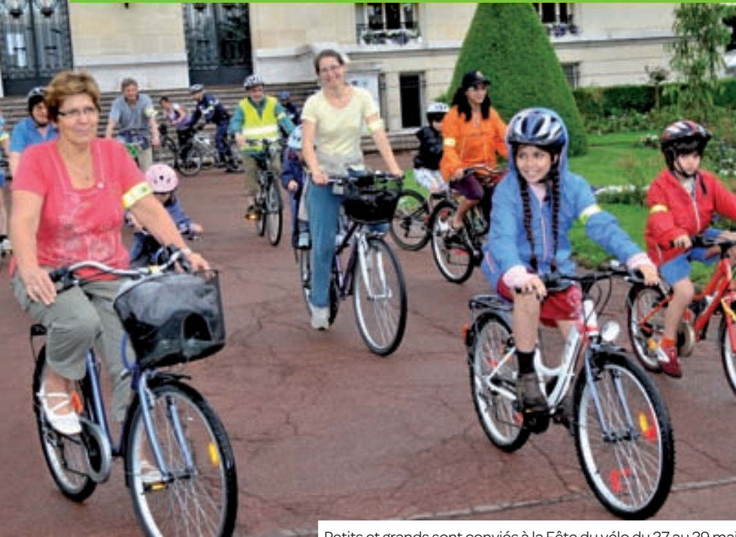
Petits et grands sont conviés à la Fête du vélo du 27 au 29 mai.