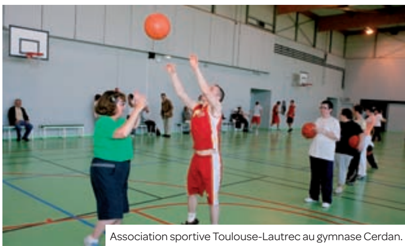
Association sportive Toulouse-Lautrec au gymnase Cerdan.

coordinateur UNSS. Quatre pôles d'animations proposeront – entre autres activités – des parcours en fauteuil, des relais athlétiques guidés, de l'escalade les yeux bandés, du torball, de la pétanque adaptée, mais aussi des ateliers de langage braille et d'initiation à la langue des signes. « Nous voulons montrer à nos élèves que le handicap n'est pas un obstacle à la pratique sportive, et qu'il est indispensable d'adopter un regard plus tolérant sur les différences. »