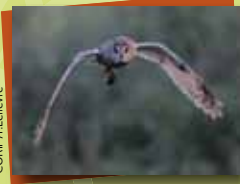
CORIF / Lelèvre