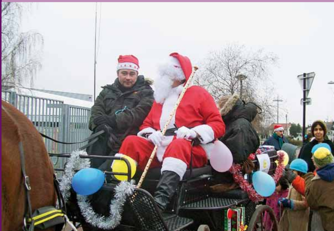
La calèche et le cheval mis à disposition par l'institut médico-éducatif Toulouse-Lautrec ont permis au défilé d'avoir lieu.