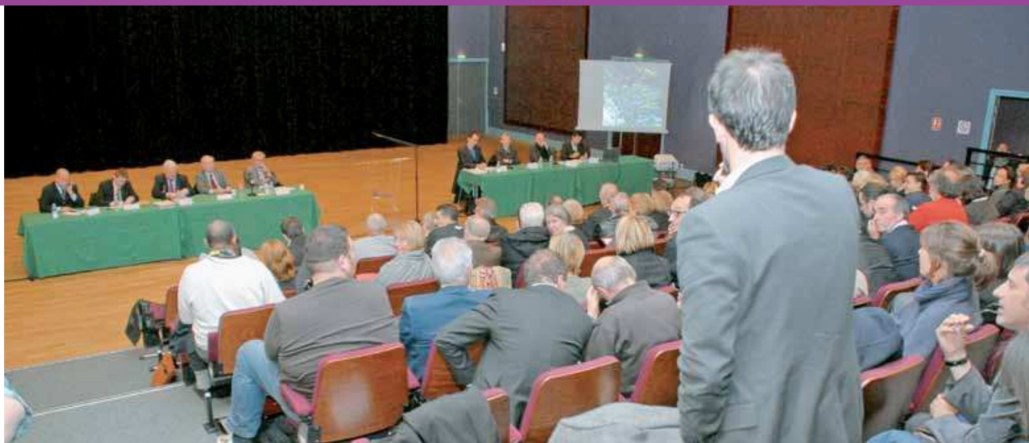
Une réunion publique d'information et de concertation se déroulera le 13 décembre à l'Espace Jacques-Prévert.