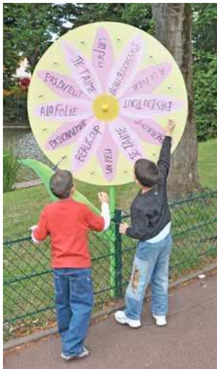
Le jury a également apprécié les jardins potagers au pied des immeubles ainsi que les actions pédagogiques.

Sans véritable surprise, le jury a rendu un verdict positif soulignant la qualité du travail effectué par la Ville et ses services.