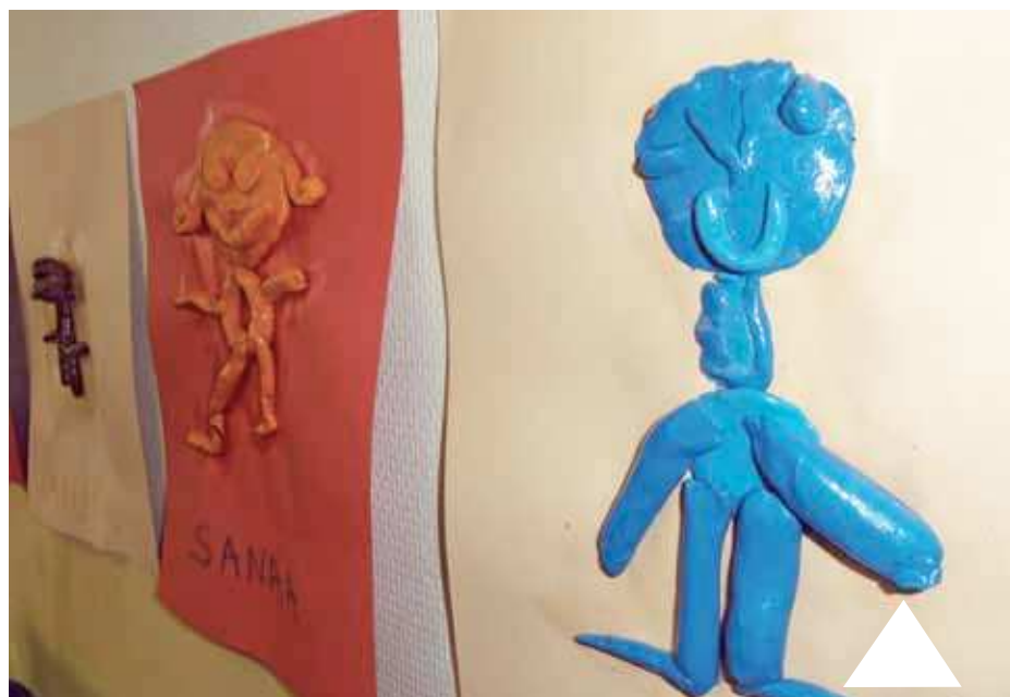
Dessins en volume réalisés par les enfants déficients visuels de l'école Nonneville 2.