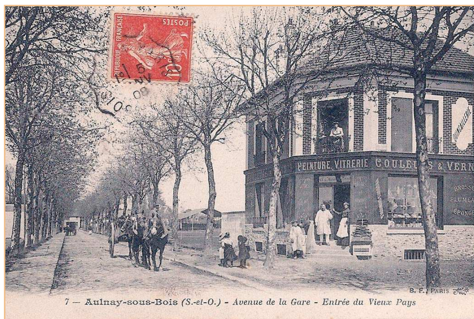
7 - Aulnay-sous-Bois (S.-et.-O.) - Avenue de la Gare - Entrée du Vieux Pays