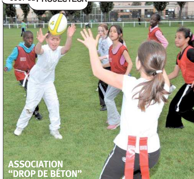
ASSOCIATION "DROP DE BÉTON"