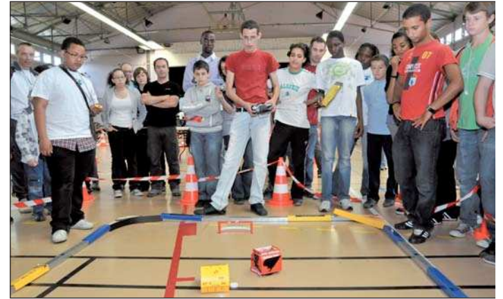
1- Le maire remet aux élèves de CP de l'école Vercingétorix la coupe du 1 er prix de l'épreuve de vitesse. • 2- L'équipe RT06 du collège Hector Berlioz de Vincennes finaliste du tournoi Rob'OK.