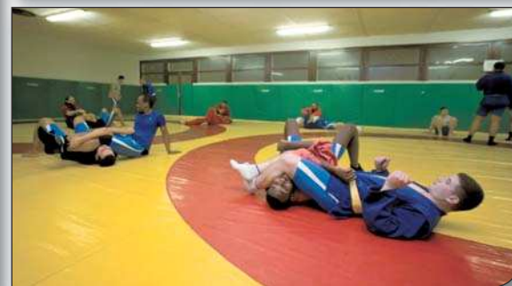
Discipline, exigence et rigueur sont les maîtres mots lors des entraînements.