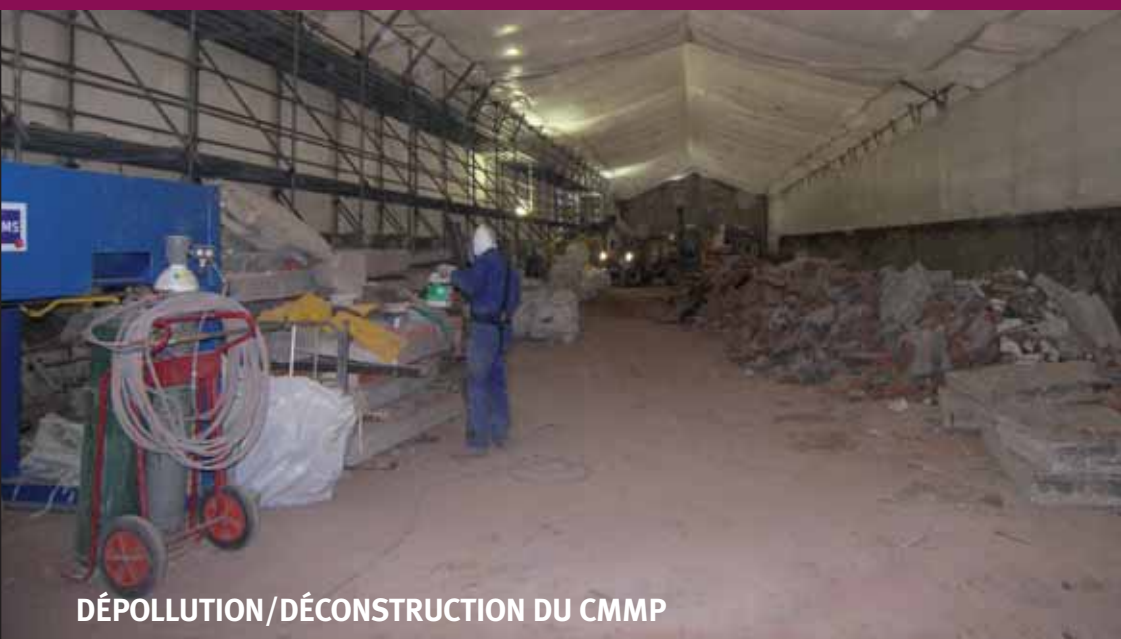
DÉPOLLUTION/DÉCONSTRUCTION DU CMMP