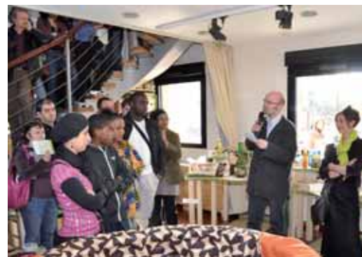
Le riz dans tous ses états et sous toutes ses formes a séduit un grand nombre d'Aulnaysiens lors du vernissage de "Terre de riz"