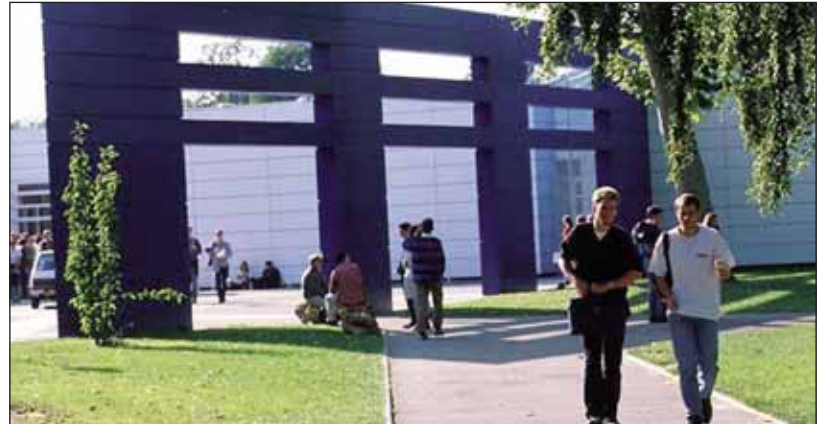
Les étudiants d'HEC, ici sur le campus, s'engagent en faveur de la diversité.

Le mentoring social s'appuie sur des associations, organismes publics référents dans le domaine de l'insertion professionnelle, et n'a pas pour but de se substituer à ces derniers. Chaque HEC est invité à jouer un rôle de mentor. Il s'engage à se rendre disponible et assurer un suivi régulier de son filleul. Son rôle consiste à assurer un parrainage classique : revue des savoir-faire fondamentaux, aide à la recherche d'emploi et à la construction d'un réseau. L'AFIP a, pour sa