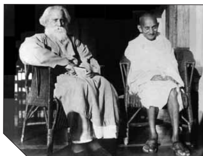
Tagore auprès de Gandhi...

LA BIBLIOTHÈQUE DUMONT PROPOSE, DEUX JEUDIS PAR MOIS, UNE CONFÉRENCE LITTÉRAIRE CONSACRÉE À UN PRIX NOBEL DE LITTÉRATURE.