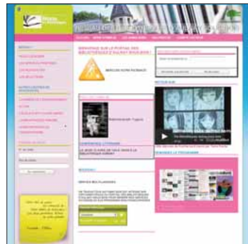
Les cinq bibliothèques municipales et les équipements culturels désormais à portée d'écran constituent un précieux centre de ressources pour les usagers.

se trouvent de façon complète et sécurisée, la liste des prêts, les documents en retard, les paniers de recherche et la liste des réservations. Sont également mises en ligne toutes les informations pratiques telles que horaires, localisations, modalités d'inscription, fonctionnement... Une rubrique "agenda" informe les utilisateurs sur les animations proposées par les bibliothèques pour le mois en cours. Dans un autre onglet "retour sur", des photos ou vidéos des animations passées permettent de revivre ou de découvrir les moments passés avec auteurs, conteurs, slameurs... Une rubrique "nouveau" affiche les dernières acquisitions des bibliothèques. Il est enfin possible d'envoyer directement questions, suggestions ou autre message aux bibliothécaires. La mise en ligne du site du Réseau des bibliothèques constitue une manière simple, pratique et ludique d'accéder à la totalité de l'offre de documentation que compte la ville.