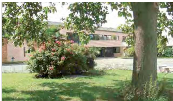
L'établissement est l'un des deux seuls du département à assurer une telle formation.

POUR L'ANNÉE SCOLAIRE 2009/2010, LE BAC + 2 CHANGE D'INTITULÉ ET DEVIENT LE BTS COMMUNICATION. LE BREVET DE TECHNICIEN SUPÉRIEUR QUI PRÉPARE AUX MÉTIERS D'ASSISTANT RESPONSABLE DE COMMUNICATION, DE COMMERCIAL EN RÉGIE PUBLICITAIRE, DE CHARGÉ DE RELATIONS PUBLIQUES... CHANGE SES CONTENUS DISCIPLINAIRES POUR ÊTRE PLUS EN ADÉQUATION AVEC LA PROFESSION.