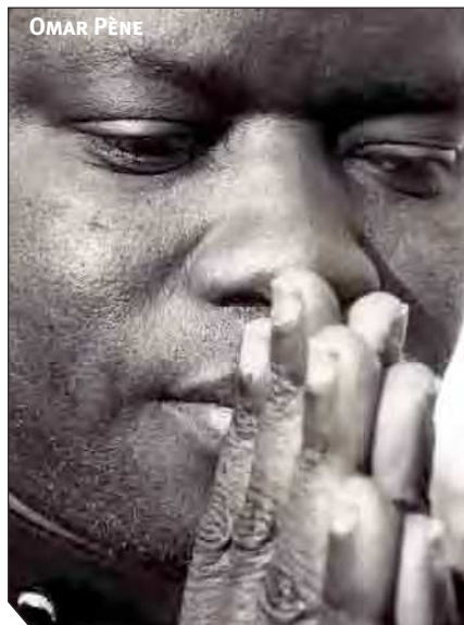
Omar Pène et SMOD Samedi 3 avril à 20h30 Le Cap • 56 rue Auguste Renoir Tarifs : 8€/6€/4€ • Réservations : 01 48 66 94 60

“JE NE ME LASSERAI JAMAIS DE DÉNONCER CERTAINES SITUATIONS. C’EST UNE SORTE DE MISSION À MES YEUX”. PLUS QUE JAMAIS, APRÈS TRENTE ANS DE CARRIÈRE, OMAR PÈNE ANCRE SON ŒUVRE MUSICALE DANS LA RÉALITÉ SOCIO-POLITIQUE DU SÉNÉGAL ET DE L’AFRIQUE. BALLADES FOLK, COMPLAINTES JAZZY, LA VOIX VIBRANTE ET PROFONDE D’OMAR PÈNE SERT DES TEXTES GRAVES SUR DES MUSIQUES AÉRIENNES ET FASCINE TOUJOURS AUTANT.