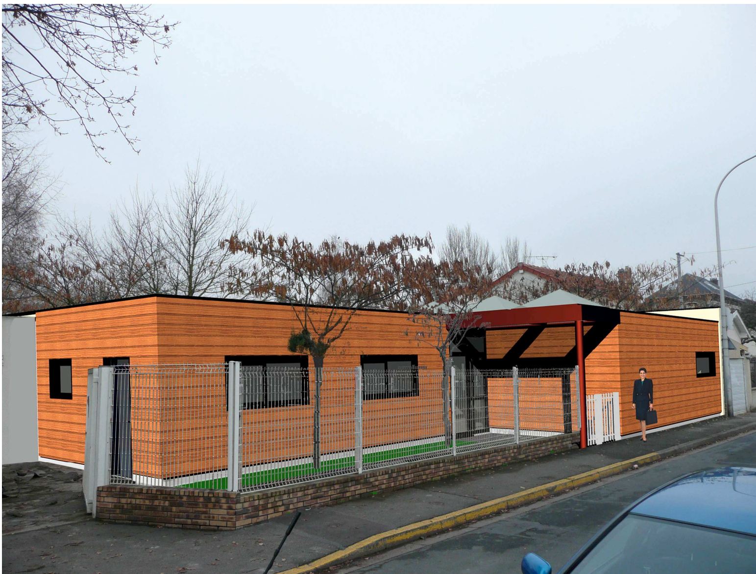
Intégration rue P. GASTAUD