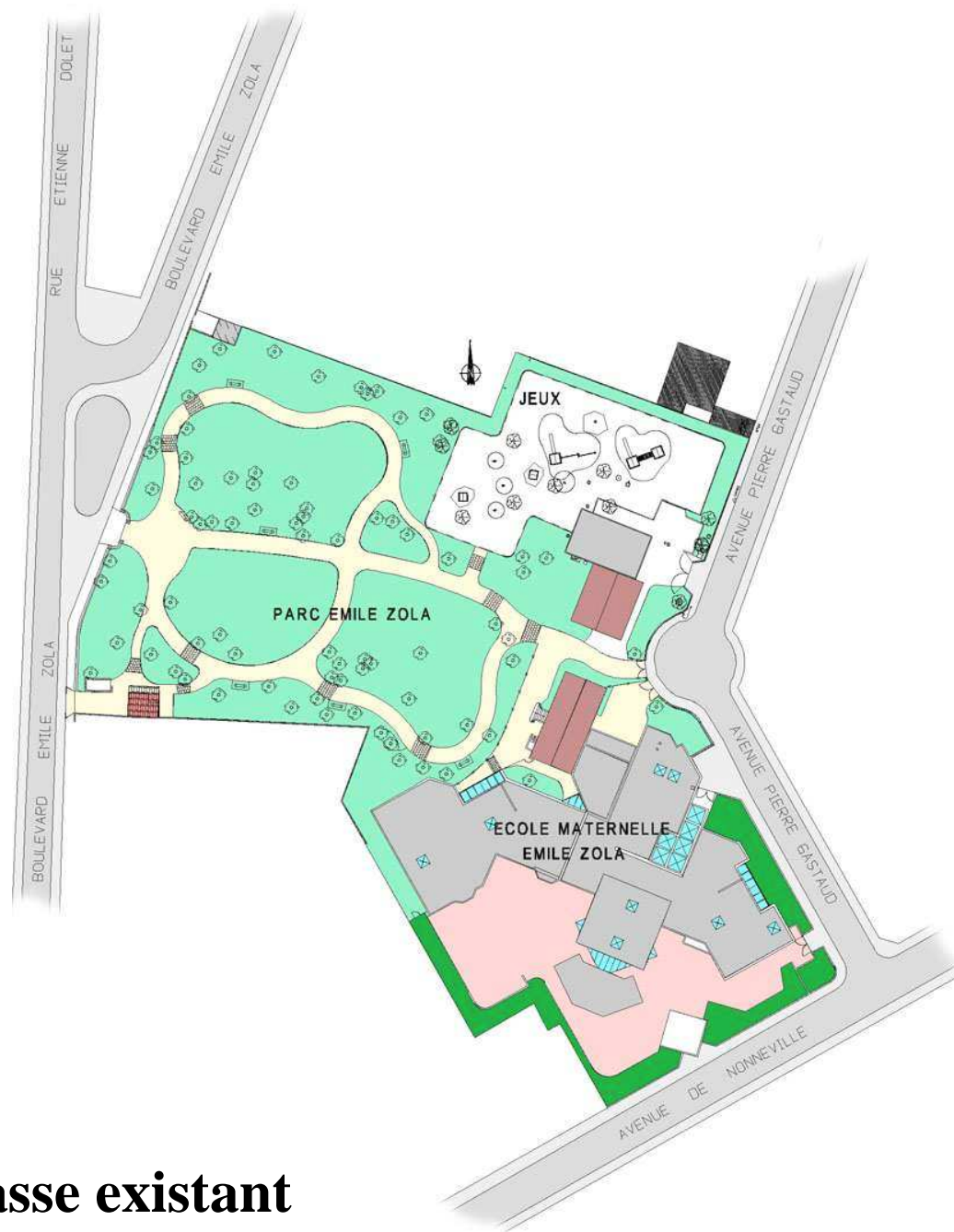
Plan de Masse existant