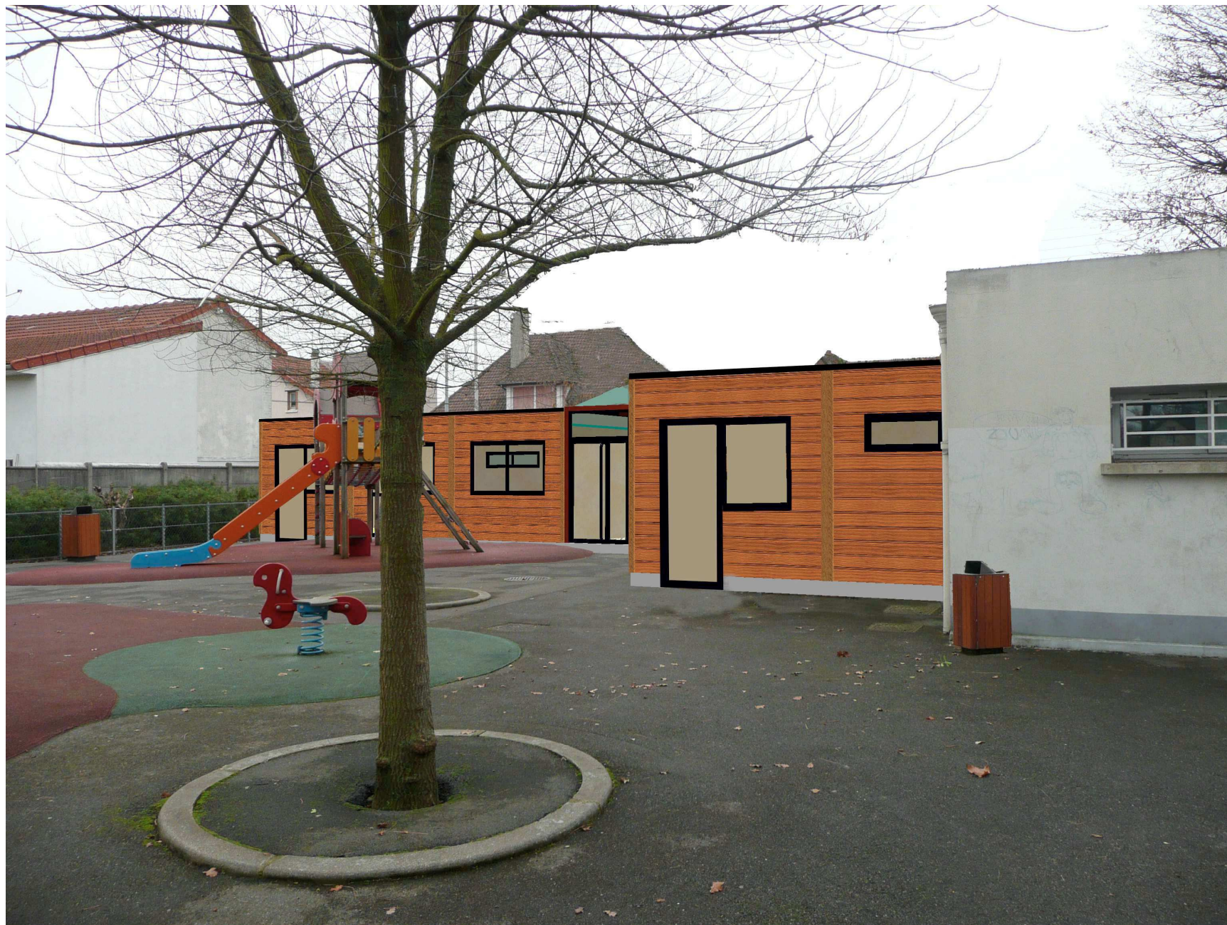
Intégration côté jeux