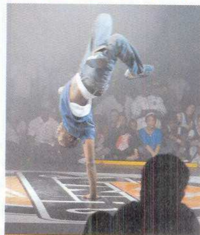
Lors du conseil municipal du 23 avril, la Ville a voté une subvention exceptionnelle à l'association VNR pour l'organisation du championnat.

smoke, puisque sur sept danseurs, c'est le premier à décrocher sept victoires qui l'emporte", détaille Blaise-Pascal. En faisant fumer le dancefloor il va sans dire. Les organisateurs comptent aussi beaucoup sur les prestations des artistes d'Aulnay, "la ville pionnière du mouvement en France", et d'Ukraine. "Actuellement, c'est de là-bas que vient l'originalité", estime Blaise-Pascal. L'association VNR existe depuis 1996 et est basée au Galion. Cette année son concours, dont Le Cap se charge, notamment de la partie technique, aura pour thème "Danse sur le monde". L'association diffuse et promeut la culture hip-hop à travers une démarche éducative. Une culture qui n'a pas de frontières, elle s'enrichit du quotidien, des modes de vie, des mentalités, des cultures et des traditions de chaque pays qu'elle traverse. Le hip-hop comme danse universelle. ■ Stéphane Legras