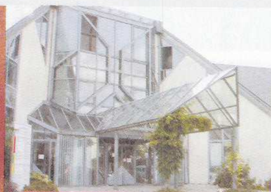
Le Centre Municipal d'Éducation pour la Santé Louis Pasteur