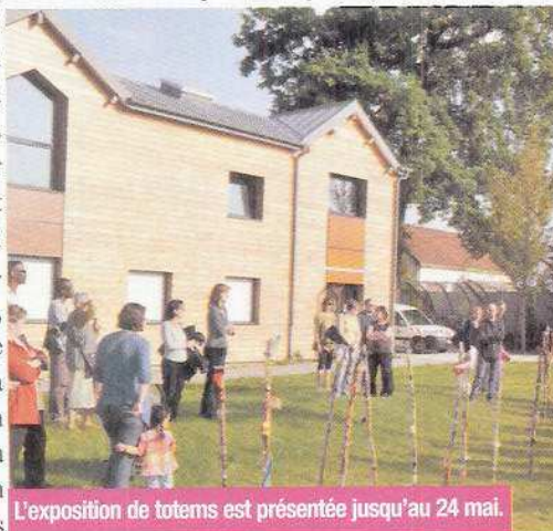
L'exposition de totems est présentée jusqu'au 24 mai.

important de respecter notre planète. A noter qu'une visite guidée est organisée le mercredi 20 mai de 15h à 17h. La