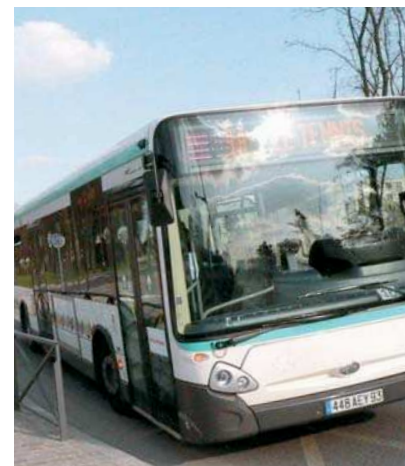
La ligne 609 ira à partir du 6 avril jusqu'à la gare RER de Villepinte.

du Gros Saule le week-end, et l'amélioration de la ligne 616. L'objectif est toujours de rendre les transports en commun performants et attractifs. «Pour que la voiture ne soit plus une fatalité», conclut l'élu. ■ Stéphane Legras