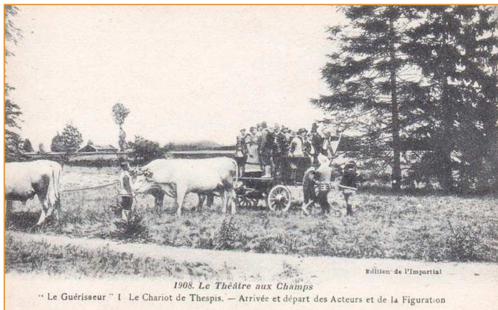
1908. Le Théâtre aux Champs