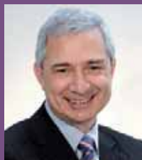
Claude Bartolone Président du Conseil général Député de la Seine-Saint-Denis

Le développement durable est l'enjeu des sociétés du XXI e siècle. Celles-ci doivent affronter la crise énergétique, le changement climatique, les atteintes à la biodiversité, les risques sanitaires... Ces enjeux ne sont pas seulement d'ordre écologique. Ce sont aussi des enjeux sociaux tant ils révèlent les inégalités entre les hommes et les disparités entre les territoires.