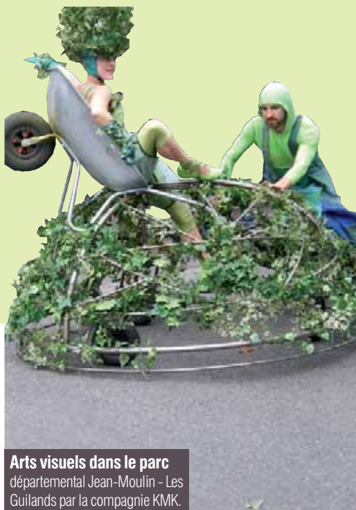
Arts visuels dans le parc départemental Jean-Moulin - Les Guilands par la compagnie KMK.

À l'heure où le vieux modèle industriel craque, ce spectacle entre conte et théâtre adopte une posture citoyenne et donne fièrement la parole aux ouvriers. Un témoignage sur les conditions de vie et de travail contemporaines qui permet d'aborder des problématiques économique, sociale et également environnementale avec les questions de santé au travail.